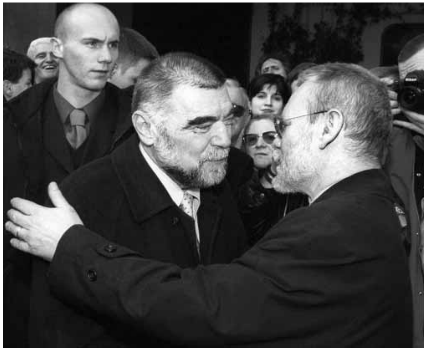
Tko će imenovati šefove obavještajnih službi - predsjednik Stjepan Mešić ili premijer Ivica Račan

No, u prijelaznom razdoblju, dok Sabor ne izglasa ustavne promjene, a time i smanjenje predsjedničkih ovlasti, Žunec ne predviđa mo-